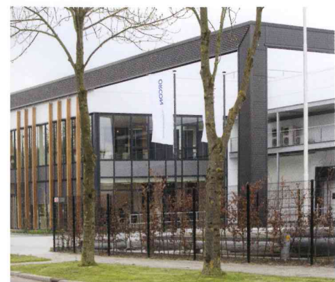
Bedrijfspannd Veenendaal: vrijwel energieneutraal

Het eenvoudigst naar energie nul te brengen, volgens Voorhoeve, zijn nieuwbouw woningprojecten. Die worden tegenwoordig immers - vrijwel zonder uitzondering - hoogwaardig geïsoleerd. Voorhoeve: "Uitgangspunt van Green Igloo is all-electric: vanzelfsprekend geen installatie van cv-ketels meer, maar verwarming en koeling met onze Fujitsu lucht/water-warmtepompen. De Orcon ventilatieproducten sluiten hierop aan en zorgen voor een zowel energiebesparende als comfortabele luchtbehandeling.