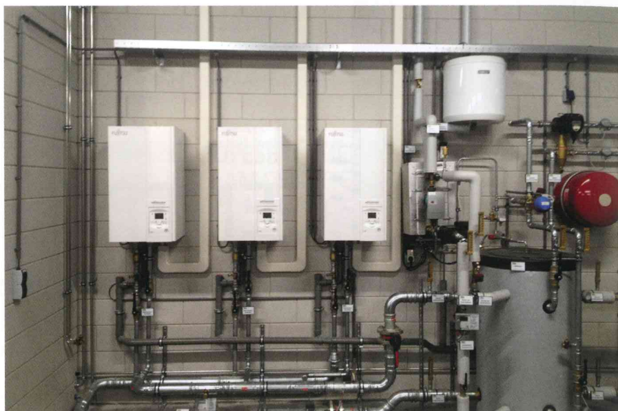
Opstelling Waterstage in project Kampen

En Voorhoeve kan het weten. Sinds vorig jaar zijn haar bedrijven Orcon & Thercon namelijk gevestigd in een (vrijwel) energieneutraal bedrijfspand in Veenendaal. In principe alles waar Green Igloo voor staat, zit erin: het kantoorgedeelte wordt verwarmd,